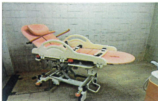
特殊浴槽ストレッチャー