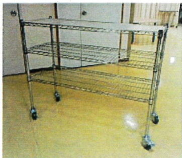
〈従来型特養〉配膳台車